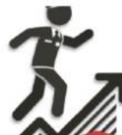
Sistema profesional de carrera policial